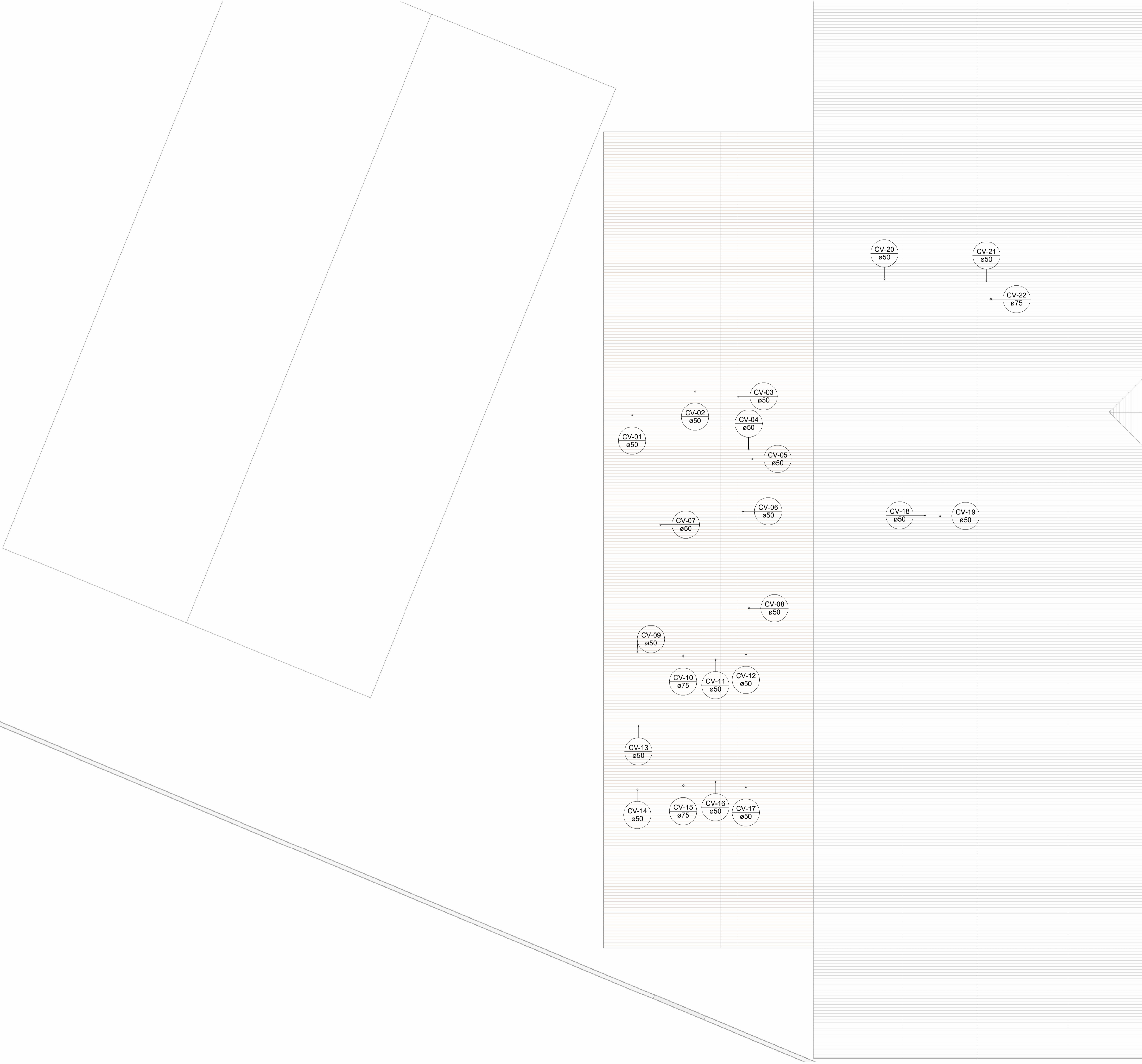
PLANTA BAIXA ESGOTO SANITÁRIO - COBERTURA Escala 1 : 100